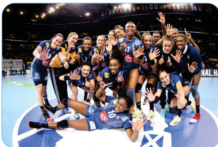
Joueuses de l'équipe de France au Mondial 2017