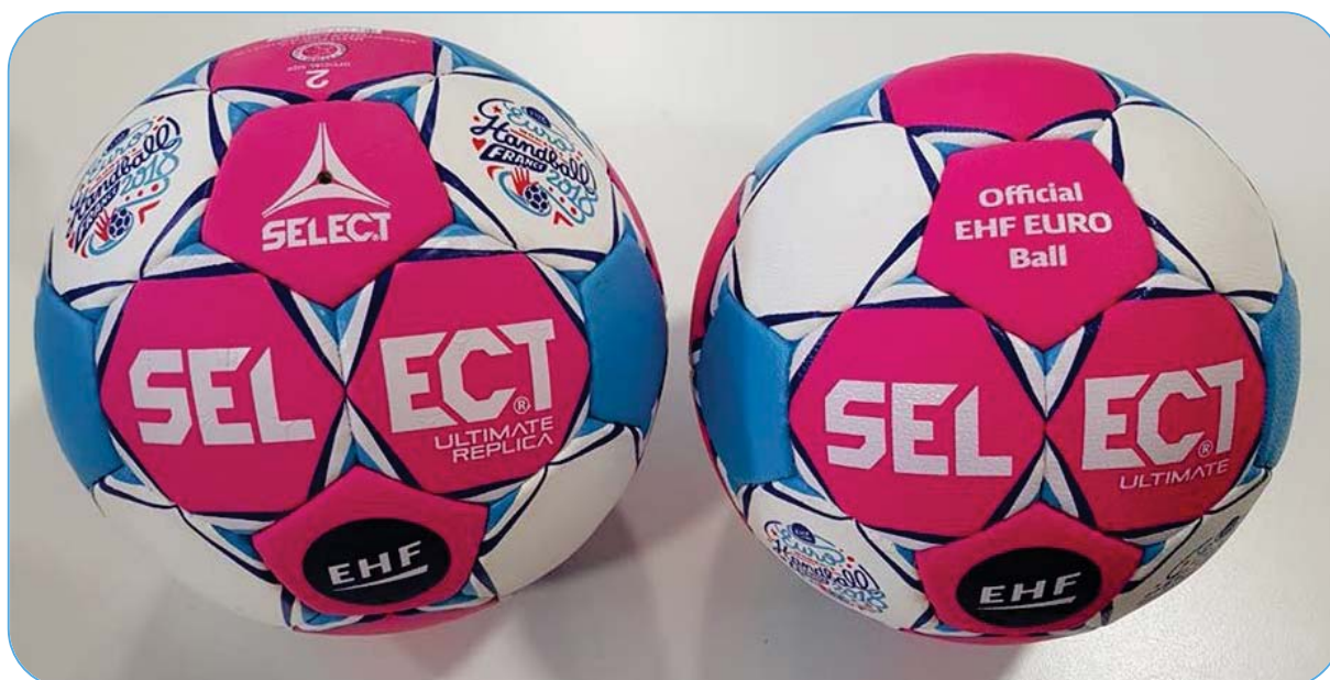
Ballon officiel Select de l'EHF EURO 2018